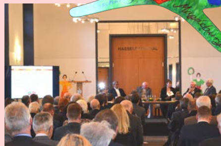
Lesebeiträge der „Schreibkräfte“ mit musikalischer Untermalung, Preisverleihung an Gewinner des Städtepartnerschaftsquiz und der Fotoaktion, eine Fotopräsentation mit anschließendem Buffet für vielfältige Begegnungen zwischen Bürgerinnen und Bürgern beider Städte