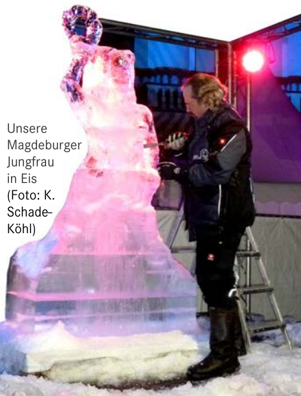
Unsere Magdeburger Jungfrau in Eis